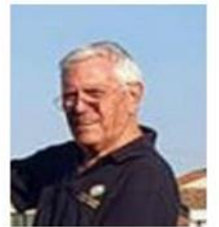
di Giuseppe Zambon

Lo sport, in queste pagine, si fa racconto, memoria, denuncia, poesia. E il Bancarella Sport continua a essere il luogo dove tutto questo prende voce.