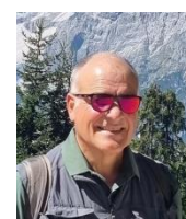
di Diego Vecchiato

Giugno, come sempre, è un mese carico di eventi e di appuntamenti, molti dei quali, però, concentrati negli ultimi giorni, costringendoci a un lavoro intenso per poter permettere l'uscita del nostro Notiziario con soddisfacente puntualità.