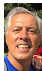
di Massimo Carlon

Serata di magia, sabato 21 giugno 2025, al Pattinodromo Quattro Fontane del Lido di Venezia, dove eleganza e talento hanno illuminato il 16° Gran Galà dei Campioni di Pattinaggio. L'evento, curato nei minimi dettagli dalla storica Associazione Sportiva Hockey Club Venezia, ha regalato emozioni autentiche, incantando il pubblico con esibizioni di altissimo livello e un'atmosfera carica di entusiasmo.